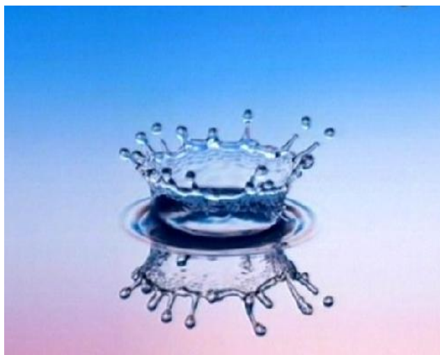
První fáze – kráter