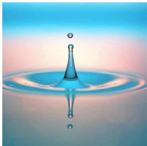
Druhá fáze – středový výtrysk

Ve vztahu k Bibli může první fáze dobře zobrazovat „Stvoření“ a druhá fáze svým návratem zpět vzhůru spíše „Spasení“.